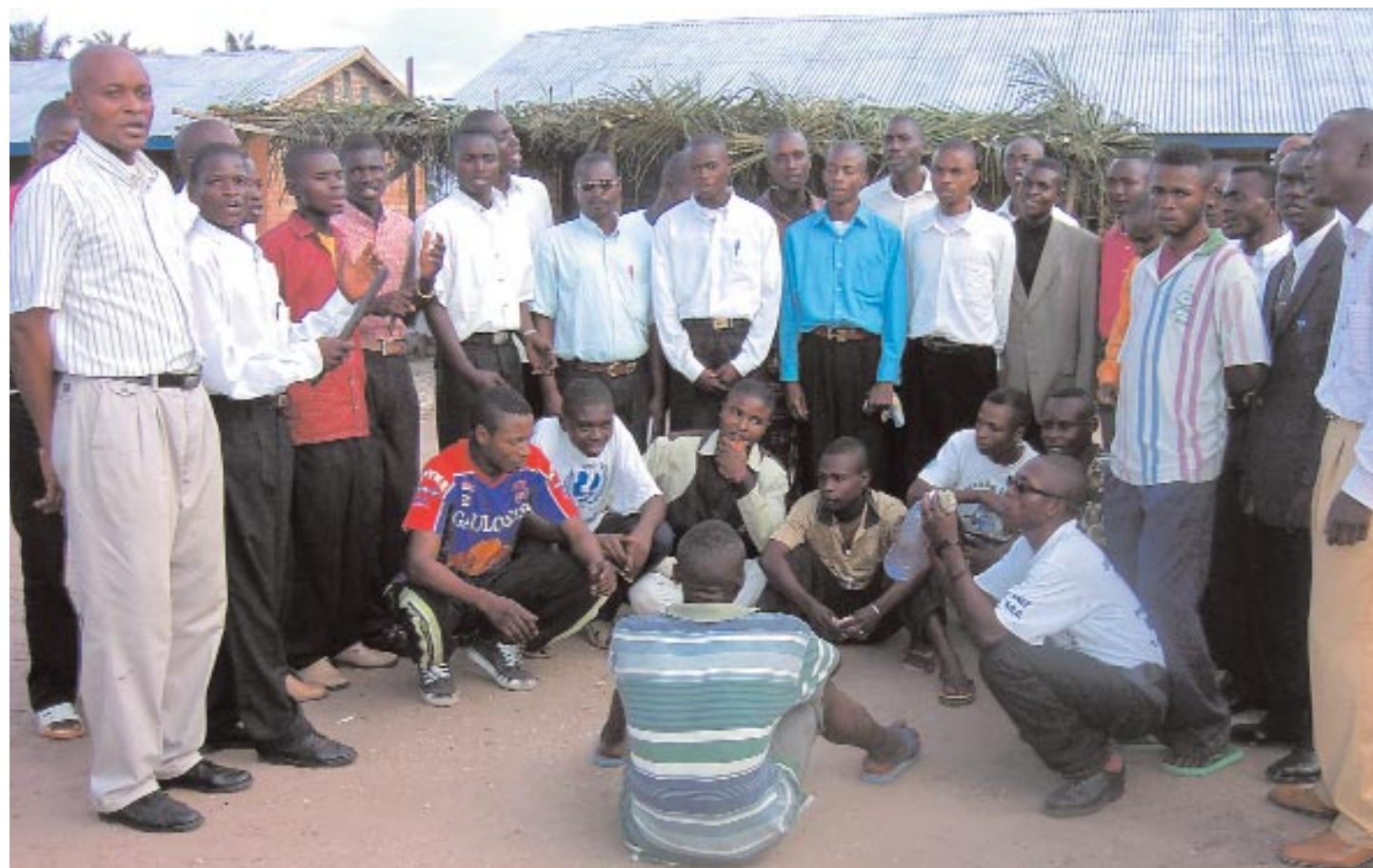
Ici entourés d'une chorale de Kananga qui chante la Paix et l'Espérance, les jeunes démobilisés se préparent pendant 3 mois au CTO à réintégrer la vie civile à travers les différentes activités qui leur sont proposées.

... Le Boeing de la Monuc a atterri à Kindu, le bus nous a déposés au siège de cette Institution des Nations-Unies dans le centre-ville.