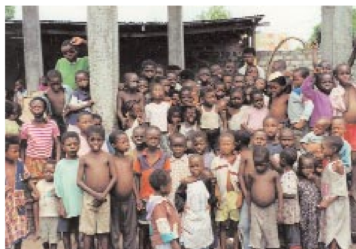
Ces enfants accusés de sorcellerie et rejetés de leur famille ont trouvé refuge dans une église de réveil aux allures de « Cour des miracles » ... L'encadrement éducatif n'y constitue pas une priorité.

Bien souvent ces pasteurs incitent les familles en proie à des difficultés à désigner un des enfants comme coupable de leurs malheurs parce que « sorcier », et à venir le faire exorciser. Il est fréquent que ces enfants soient « jetés à la rue » après avoir subi de nombreuses violences. Ces enfants stigmatisés et traumatisés sont souvent « récupérés » par ces pasteurs qui, parfois sous couvert d'une « délivrance » abusent sexuellement d'eux.