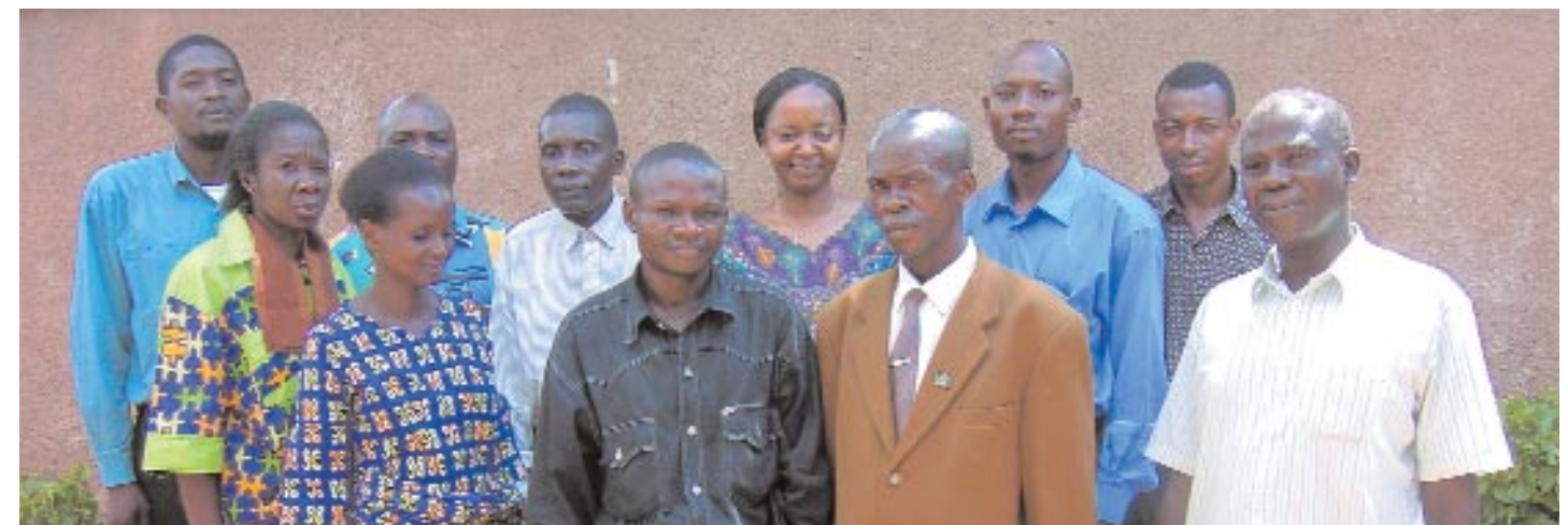
Les membres de l'équipe du BICE Mbuji-Mayi avec les responsables des Comités Locaux qui prennent à cœur leur rôle de promoteurs des droits de l'enfant dans leur quartier.

Par ailleurs le BICE a mené, en synergie avec les Comités Locaux de Protection et ses partenaires du Réseau pour l'Intérêt Supérieur de l'Enfant, des actions, largement médiatisées, de sensibilisation de la population sur cette problématique. Ces actions ont visé la prise de conscience du public de la nécessité de changer le regard de la société congolaise, surtout rurale, sur la femme et la fille afin que celui-ci ne passe plus à travers le prisme réducteur et discriminatoire de certaines traditions ou comportements déviants, favorisés par la guerre.