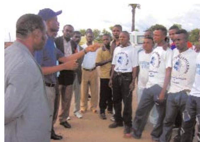
Inquiets pour leur avenir, les jeunes présentent leurs préoccupations au Vice-Gouverneur venu les rencontrer.