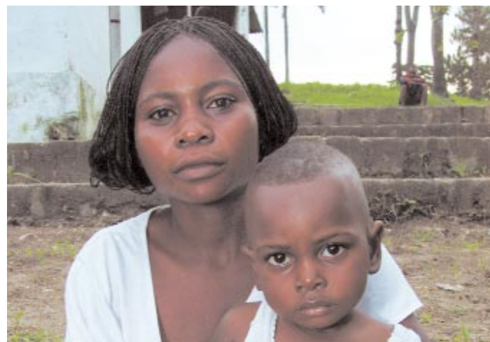
Pauvreté, manque d'éducation, violences sexuelles et conventions sociales sont les causes principales des grossesses et des mariages précoces non désirés.

A notre arrivée ici à Kananga, il me dirigea dans le quartier où habitaient ses frères. Comme il était déjà en route pour la ville de Kikwit, il a sollicité une chambre auprès des voisins pour m'enfermer pendant notre séjour. Un jour qu'il venait de me tabasser, je suis partie porter plainte chez le chef de quartier qui envoya des militaires pour l'arrêter. Il se trouve pour le moment au cachot de la Police. Mon souhait est de rejoindre ma mère dans le village natal. »