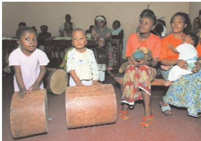
Séance d'éveil précoce pour les tous petits détenus et leurs mères. Pour que la vie en milieu carcéral affecte le moins possible leur développement, en particulier le développement moteur.

L'alternative à l'emprisonnement désormais perçue comme la règle et non l'exception. La formation et la sensibilisation des magistrats ont amené ces derniers à recourir davantage aux mesures alternatives à l'emprisonnement ( remise des enfants à leurs parents ou placement dans un centre d'accueil ) plutôt qu'à leur incarcération quasi systématique. Grâce au Centre de Réhabilitation Erb Aloïs ( Abidjan ) et au Centre de Sauvetage de Kinshasa, deux structures alternatives à l'emprisonnement aménagées et gérées par le BICE, les juges peuvent faire primer l'éducatif sur le répressif. Au Mali, Sénégal et Togo de nombreux progrès vont dans ce sens.