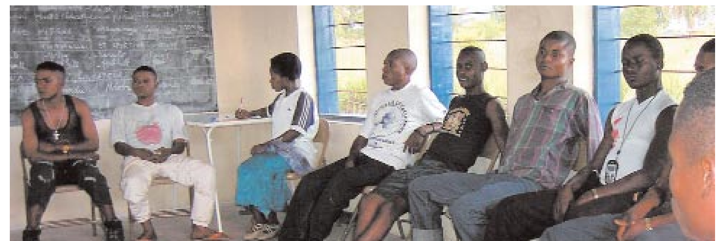
En réunion avec leurs éducateurs, les jeunes démobilisés expriment leurs attentes et leurs craintes quant à leur retour à la vie civile.

Là encore une approche communautaire et une sensibilisation systématique s'avèrent indispensables. La mobilisation des familles et des communautés autour de l'avenir des enfants est un des nombreux défis à relever pour gagner la paix.