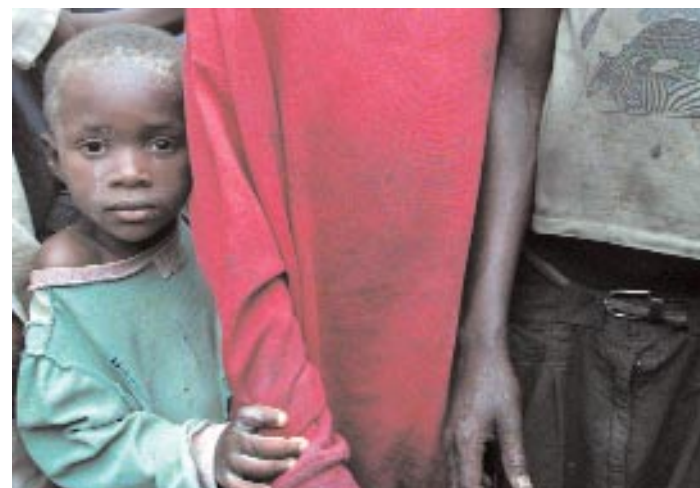
Jeunes, sans expérience et livrées à elles-mêmes, ces jeunes filles et leurs enfants ont, sans soutien, peu de perspectives d'avenir.

Discrimination des filles et banalisation des abus dont elles sont victimes. Ce témoignage de Chantal démontre combien la situation des femmes et des filles est difficile à vivre dans un contexte fortement empreint de traditions discriminatoires à leur égard.