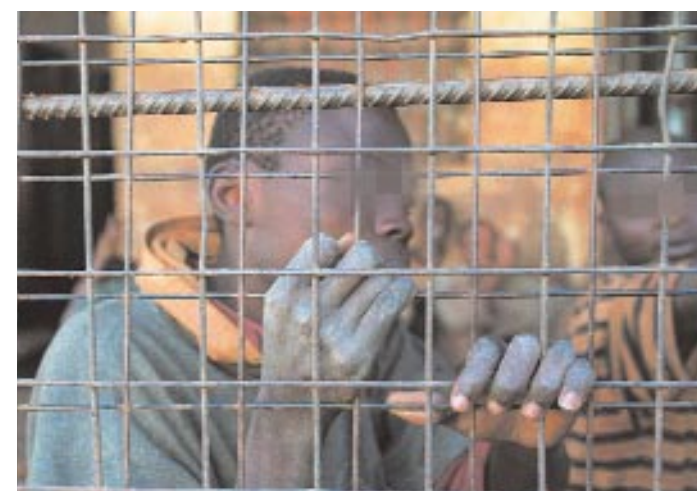
Certaines conditions de détention demeurent infra humaines, les mineurs restent encore trop souvent mêlés aux adultes ; mais de plus en plus, les mentalités évoluent et les Etats mettent en œuvre des solutions alternatives à l'emprisonnement pour les enfants.

En cas d'échec de la médiation ou d'infractions graves, le BICE a apporté aux enfants concernés une assistance juridique et judiciaire. Des avocats ont effectué les démarches nécessaires pour faire progresser les dossiers dans les délais prévus par la loi. Au cours des audiences, les interventions des travailleurs sociaux et avocats du BICE se sont complétées pour veiller à ce que les décisions soient prises en conformité avec la loi et dans le respect de l'intérêt supérieur de l'enfant.