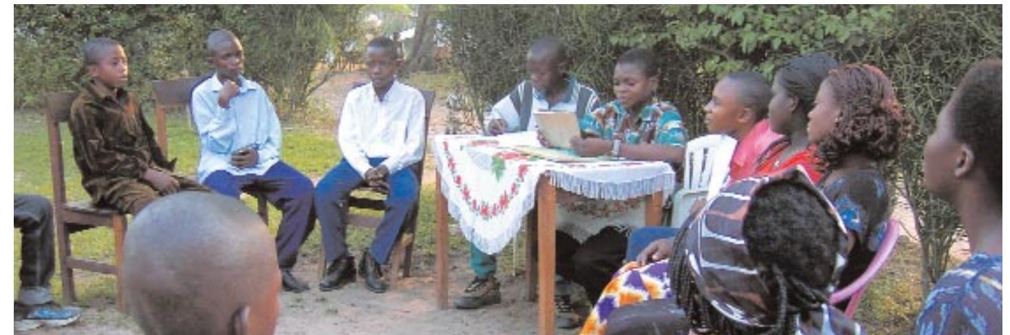
Ces adolescents se sont constitués en Comité Local Junior, le groupe « Espérance » pour sensibiliser leurs camarades et les adultes sur les besoins et droits fondamentaux des enfants.

Ce travail m'apporte beaucoup de joie, surtout quand je vois ces enfants qui prennent des initiatives et s'engagent ... Leurs réactions qui montrent qu'ils veulent aller de l'avant nous encouragent. Ils sont reconnaissants de l'appui que nous leur apportons. »