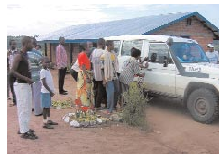
Après trois mois de préparation au retour, c'est le grand départ vers les familles et la vie civile au quotidien ; un moment attendu mais aussi redouté : que va-t-on trouver en rentrant ? Quel avenir ?