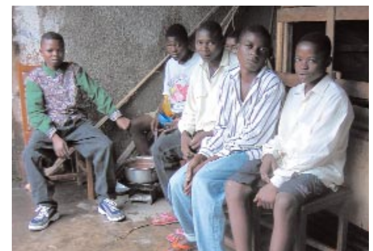
La rencontre avec d'autres enfants, l'élevage de lapins et les différentes activités éducatives diminuent le stress carcéral des enfants privés de liberté.