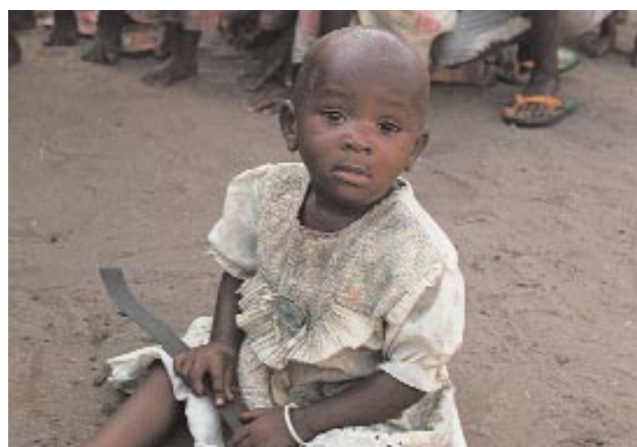
C'est souvent très jeunes que les enfants dits « sorciers » sont chassés de leur foyer. Ils sont des proies idéales pour certains « pasteurs » qui abusent d'eux et exploitent leur vulnérabilité.