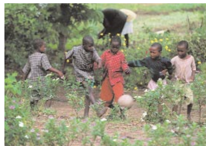
La joie de se sentir « comme les autres » et de pouvoir se prendre pour un Zidane ou un Ronaldo le temps d'une partie.

Ce projet de vie ne prend racine que dans une fertile vie communautaire, où chacun respecte autrui et ne se sent plus différent des autres.