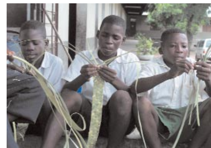
Agilité et dextérité, deux qualités qui permettent ici aux enfants dits « sorciers » de se revaloriser à travers la production et la vente d'articles de vannerie.