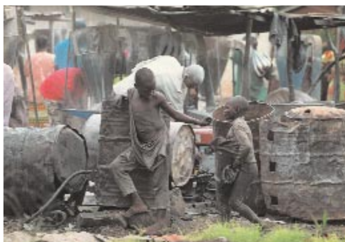
De nombreux enfants survivent difficilement. Pour gagner un peu d'argent pour se nourrir, ils pratiquent tous des petits métiers, bien souvent au détriment de leur santé, et sont souvent exploités par des adultes peu scrupuleux.

Le climat de confiance qui règne entre les enfants et les animateurs, fruit du travail d'écoute active mené par la psychologue et l'animatrice pour aider ces enfants à surmonter leurs difficultés, est lui aussi très bénéfique.