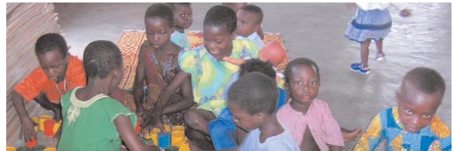
Le Centre d'Accueil de Proximité dans une habitation portefaix reçoit chaque jour une quarantaine d'enfants pour l'éveil précoce.

Beaucoup de défis doivent encore être relevés pour mobiliser les bénéficiaires, principalement les jeunes filles, et renforcer les capacités communautaires des milieux d'origine.