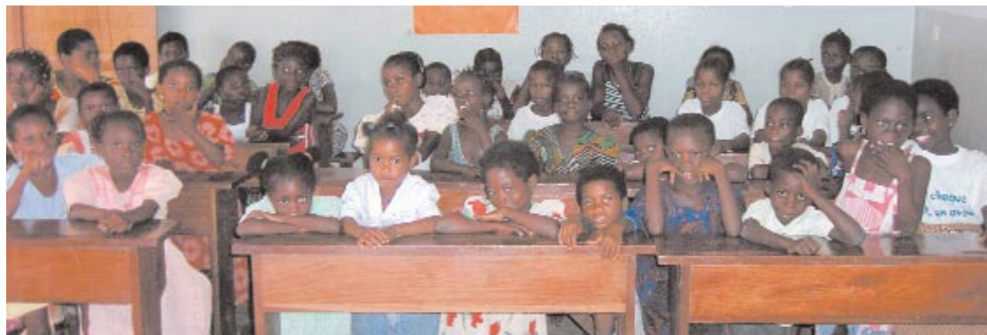
L'appui à la scolarisation des enfants des portefaix, et les activités de soutien scolaire leur permettant de mieux réussir, restent une des priorités du projet.

Le travail de portefaix lui-même est aussi perçu comme une fatalité : pour certaines filles de campagne, sans instruction, sans moyen et sans soutien, c'est une stratégie de survie. L'enquête montre aussi que la prostitution a été pour ces filles le moyen d'exercer leur besoin de détente et de loisir en toute liberté.