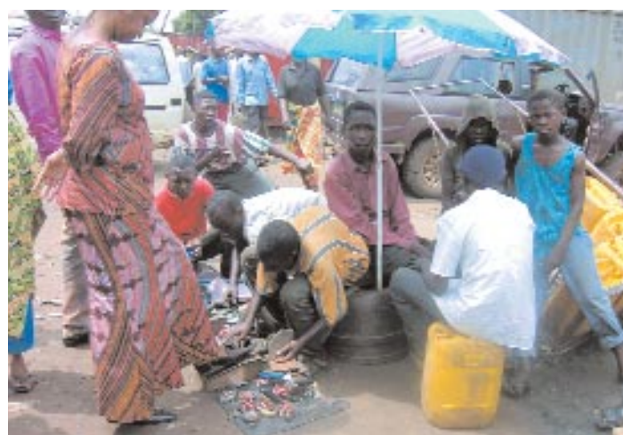
Aidés avec une caisse de cireur, ces enfants ont pu louer une chambre, se prendre en charge et retourner à l'école chaque jour.

Presque comme à l'école ... La salle d'éducation au sein du pavillon, c'est un peu « comme à l'école ». Toutes les ressources sont là pour permettre aux enfants de bien travailler ! Après les cours et avant les parties de « baby », les enfants s'occupent de leurs lapins et arrosent les amarantes et les épinards qu'ils ont plantés.