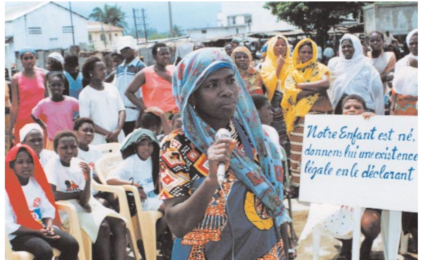
Le droit à une identité reconnue, à une existence légale reste d'une actualité de premier plan. Trop d'enfants ne sont toujours pas enregistrés dans les registres d'Etat Civil. Ce thème a fait l'objet des campagnes de sensibilisation à l'occasion de la journée de l'enfant africain le 16 juin.