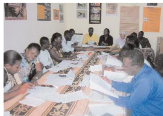
Afin de pérenniser les actions de protection et de promotion des droits des jeunes filles domestiques, les différents partenaires de terrain se sont constitués en consortium.

La survivance d'une tradition de « confiage » des enfants, mais actuellement dévoyée, rend la lutte contre la mise au travail domestique des toutes petites filles difficile, surtout à l'heure ou tout un chacun sait qu'il est interdit d'employer des mineurs de moins de 14 ans. Ces placements se font clandestinement et ces enfants sont cachés.