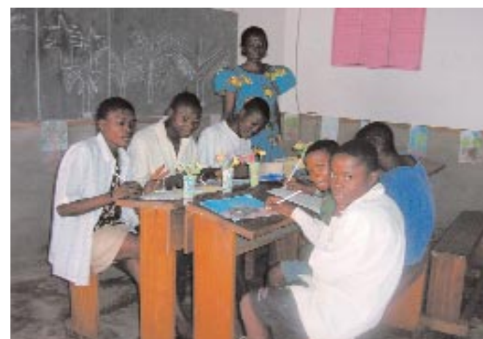
Enfants de la rue, enfants privés de liberté se retrouvent au quartier des mineurs pour l'éducation de base ...

Démultiplier les actions pour être plus fort dans la défense des droits de l'enfant. Vu la superficie de la ville de Mbuji-Mayi, le BICE n'est pas capable seul de mener toutes les actions nécessaires en faveur des enfants abusés. Il a donc opté pour une stratégie de démultiplication de ses interventions en mettant sur pied deux Comités Locaux de Protection des Droits de l'Enfant (CLPE), associations congolaises, composées de personnes militantes et engagées pour la cause de l'enfant. Ces Comités, de composition pluridisciplinaire, connaissent bien les réalités des quartiers dans lesquels ils s'impliquent. Cet atout permet de donner à leurs actions ( sensibilisation du public, assistance juridique des enfants, réinsertion sociale etc. ) une plus forte probabilité de réussite. D'autres CLPE seront prochainement créés pour un renforcement de l'action. Par ailleurs des CLPE juniors, qui permettront d'intégrer davantage les enfants dans les stratégies de sensibilisation du public et de leurs pairs sur les droits de l'enfant, verront le jour très bientôt.