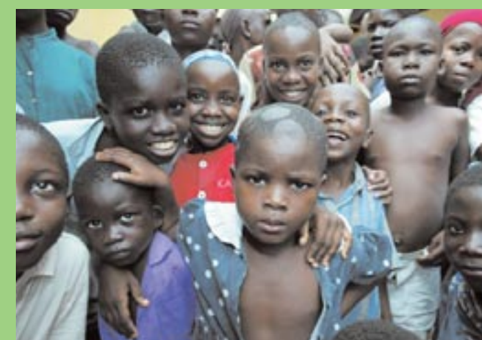
Parmi les « déplacés de guerre », de nombreux enfants, temporairement sans contact avec leurs parents, ont été accueillis dans le Centre de Sauvetage du BICE à Abidjan, où leurs besoins vitaux sont assurés.