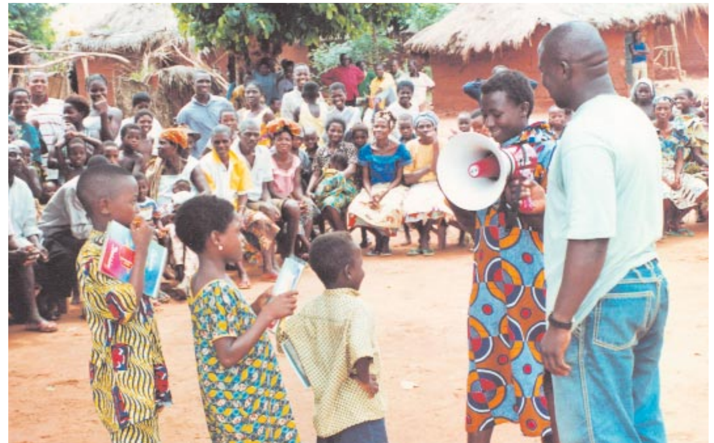
Que ce soit pour la prévention du trafic ou le droit à un état civil, la participation des enfants est requise lors des séances de sensibilisation dans les villages.

Une véritable formation professionnelle pour les filles. Une expérience pilote réalisée en partenariat avec l'IPEC/BIT ( Bureau International du Travail ) a contribué au retrait du travail de jeunes portefaix de moins de 15 ans. On observe que beaucoup de filles entre 15 et 18 ans voudraient faire un apprentissage. Une orientation spécifique vers ces groupes d'âges, par la réinsertion scolaire ou professionnelle, débouchant sur une activité génératrice de revenus, aura manifestement un fort impact sur le phénomène à Lomé. Cette dynamique mérite d'être entreprise à titre préventif en milieu rural, zone de prévalence pour la promotion du statut social de la jeune fille.