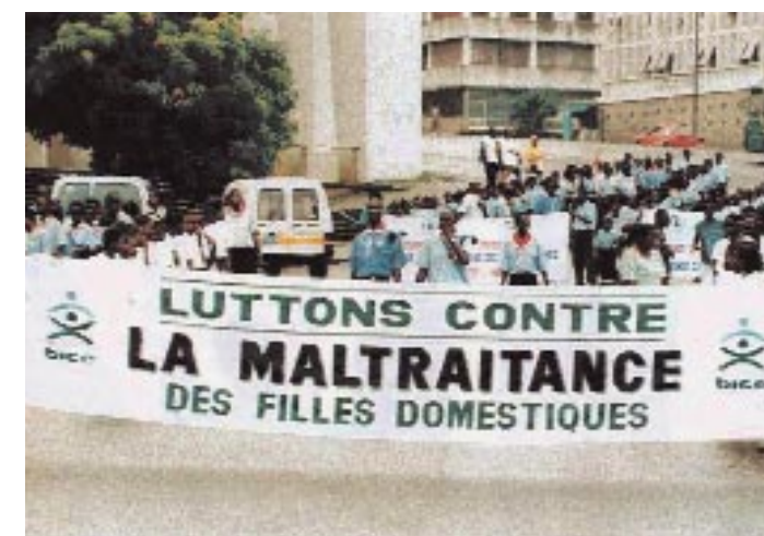
Une des actions de mobilisation sociale qui a contribué à faire évoluer les mentalités par rapport au traitement et aux droits des jeunes filles domestiques.