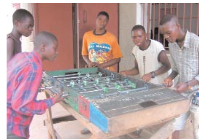
... mais aussi pour les jeux.