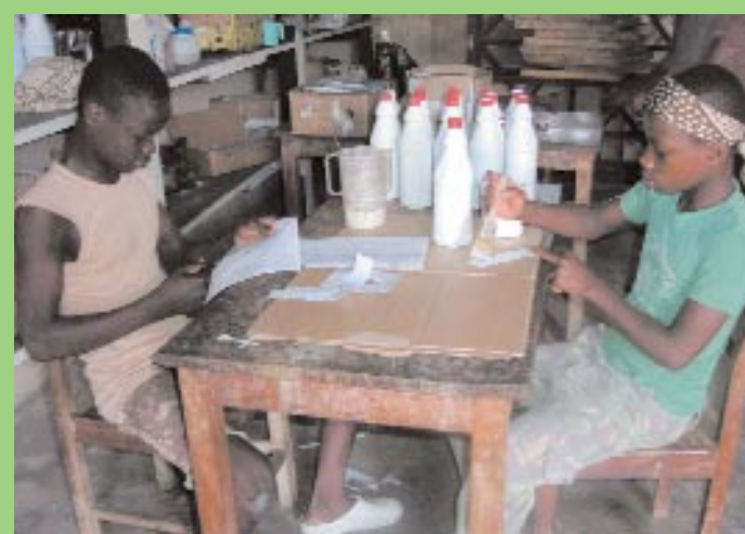
Savoir faire du savon c'est bien, mais savoir le vendre, c'est un plus indispensable. Les enfants qui se forment dans l'atelier du BICE le savent bien. Alors ils s'emploient à faire de belles étiquettes et à les coller avec soin sur les bidons, « marketing » oblige !

Il est resté là toute la journée, nul ne voulait s'en occuper. Seules les fourmis en procession commencent dans la soirée à le visiter. Tandis que ses copains de la rue, avec l'aumônier étaient venus, tout près de lui, prier, Et d'un linceul blanc ils l'ont enlacé.